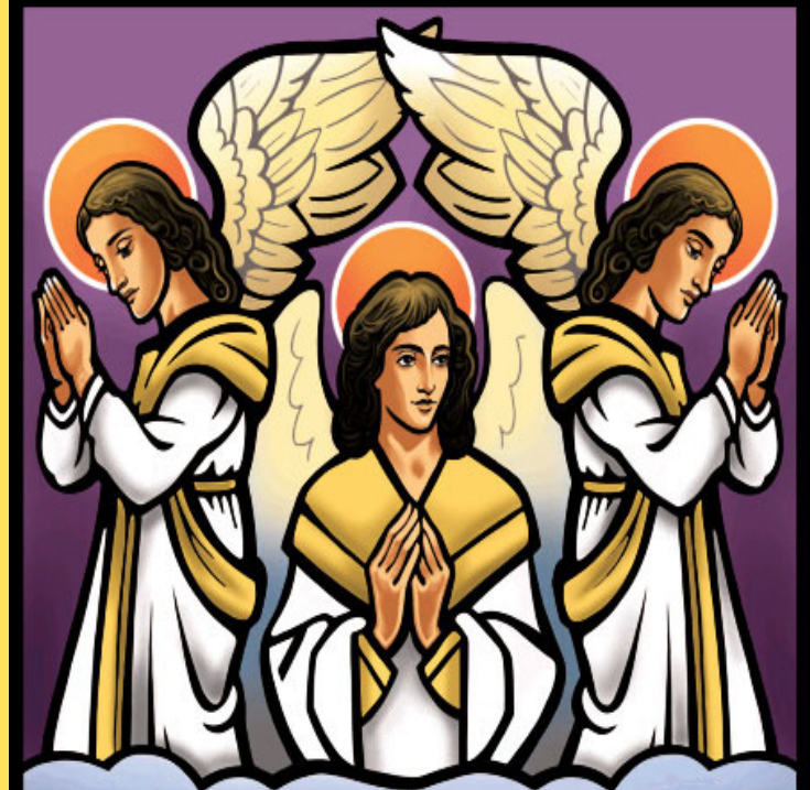
Ss. Michael, Gabriel, Raphael